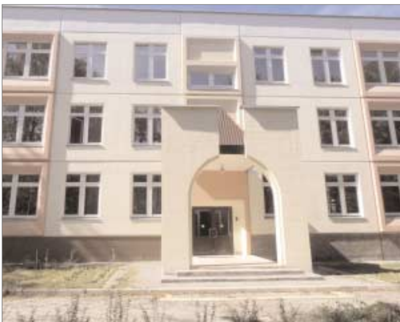
Детский сад по адресу: Щелковское шоссе, 90Б.

То, что район ремонтируется и приводится в порядок – прекрасно. Но это не означает, что все, что необходимо для комфортной жизни и развития района уже построено. Целый ряд объектов различного назначения планируется построить в Северном Измайлове.