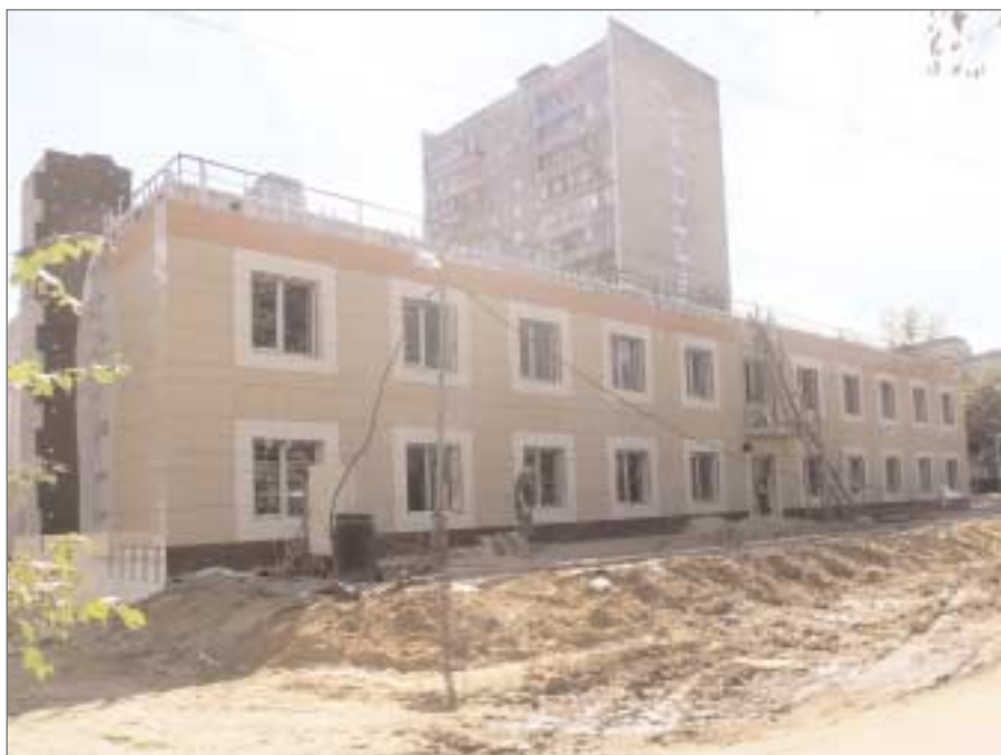
Подземный паркинг по адресу: 15-я Парковая улица, дом 46Б.