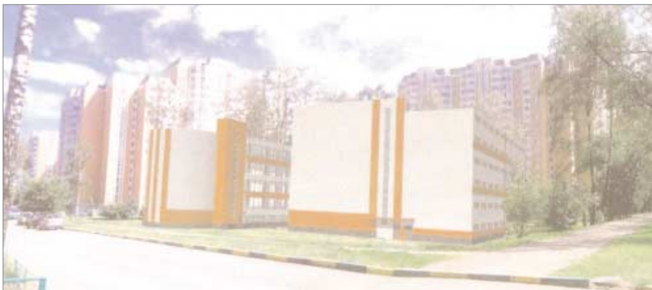
Гараж-стоянка по адресу: 13-я Парковая ул., вл. 28. Фотофиксация.

Эта стройка вызывала много споров. Но уже в начале октября, когда завершится строительство гаража-стоянки и пройдут работы по благоустройству прилегающей к нему территории, многие из тех, кто был против его строительства, смогут убедиться, что закрытый гараж пусть и не напоминает цветущую клубму, но все-таки гораздо лучше, чем скопище «ракушек» и поставленных как попало, чуть ли не друг на друге, машин.