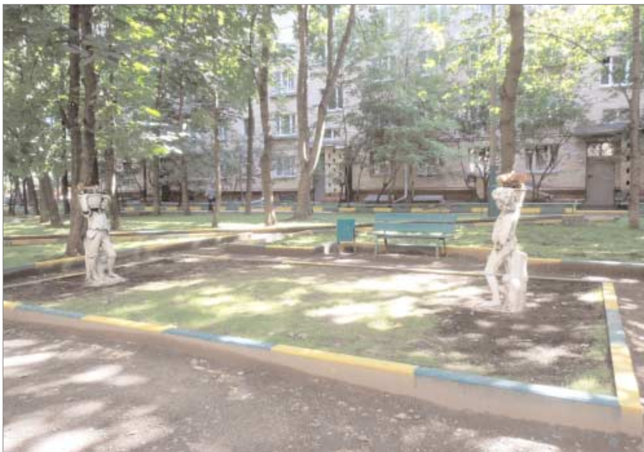
Во дворе по 11-й Парковой ул., д.44 корп.1, 2.

Мэр Москвы Сергей Собянина 9 августа в интервью телеканалу «Россия-1» подчеркнул важность общественного контроля за благоустройством: «Я добиваюсь, чтобы управы, когда принимали эти объекты, обязательно привлекали старших по подъезду, старших по дому, общественность, чтобы они тоже ходили, смотрели, что сделано. Если что-то там не то, чтобы они информировали и город, и округа. Это очень важно, чтобы не было одного чиновничьего контроля. Люди тоже должны помогать в этом благом деле, тогда у нас будет порядок».