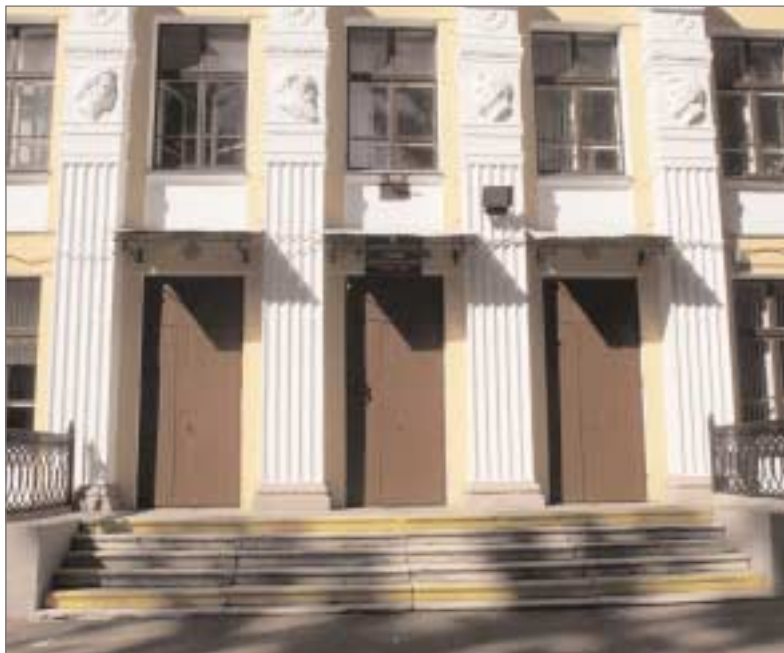
Ремонт фасада школы №399.

Два детских сада уже построены, и в IV квартале – начале 2012 года планируются к сдаче в эксплуатацию. Новое здание на 220 мест получили детские садики №585 по Щелковскому шоссе, д.90Б и №277 на 15-й Парковой, д. 40.