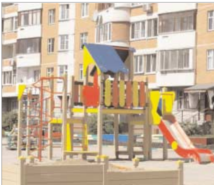
Дворовая территория по адресу: Щелковское шоссе, д.26 корп.2.