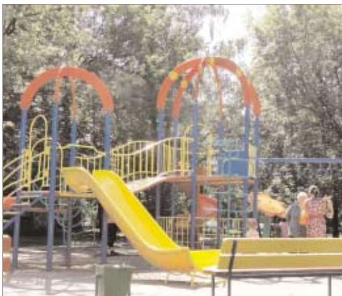
Дворовая территория по адресу: Щелковское шоссе, д.10.

По состоянию на 1 сентября отремонтировано 160 дворовых территорий.