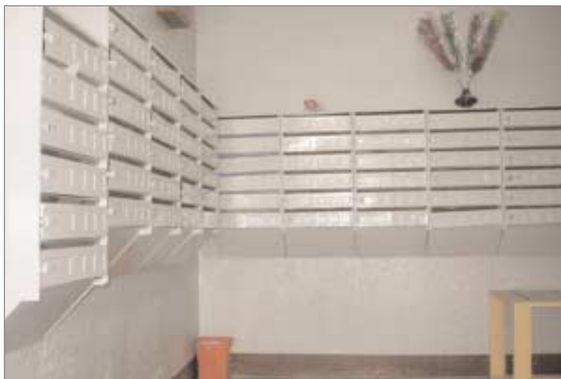
Отремонтированный подъезд дома по адресу: 15-я Парковая, д.38.