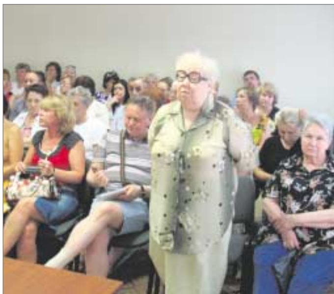
Встреча с жителями 14.07.2011.

Объявления о встречах главы управы района с жителями размещаются в районной газете, на районном сайте www.sevizm.ru , досках объявлений на подъездах жилых домов.