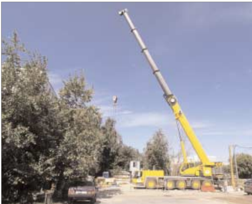
Строительство кабельного коллектора на 16-й Парковой.