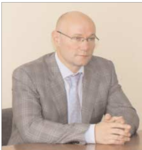
Уважаемые жители района Северное Измайлово!

Приближается к концу 2011 год. Этот год принес в нашу жизнь много нового. Новые подходы и свежие идеи мэра Москвы Сергея Собянина по развитию города нашли свое воплощение в Программе комплексного развития округов Москвы. Она стала основой планирования работы в течение года и объединила в единый комплекс деятельность по развитию и благоустройству округов и районов Москвы. Ее основная идея – последовательная работа по приведению в порядок тех сторон жизни в нашем городе, которые требуют внимания.