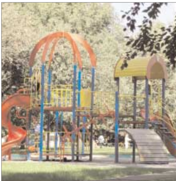
Дворовая территория по адресу: Сиреневый бульвар, д.73 корп.1.