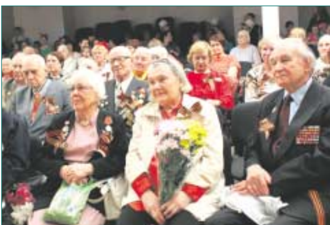
Всем ветеранам, пришедшим на праздник в центр образования «Вертикаль» № 1748, муниципалитет ВМО Северное Измайлово подготовил подарки.