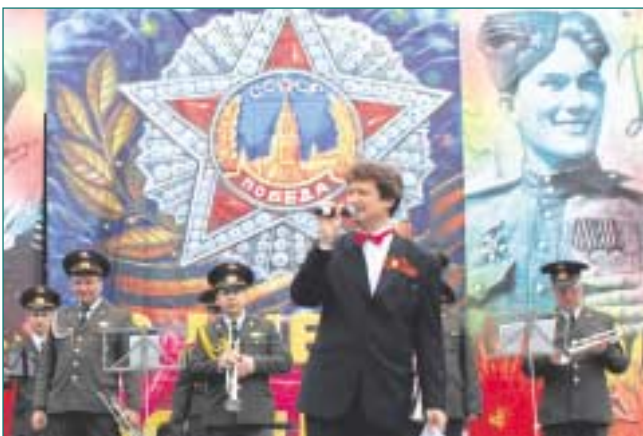
9 мая праздничный концерт у ТД «Первомайский» открылся выступлением духового военного оркестра Московского гарнизона.