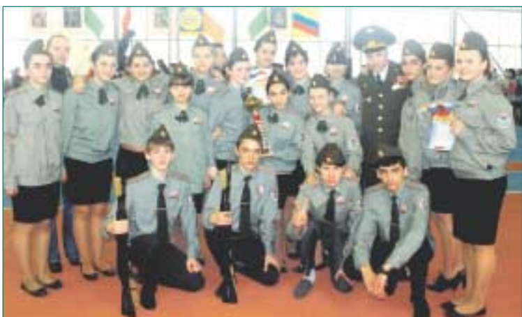
Команда ГБОУ «СОШ № 619» «Крылья», средняя возрастная группа, 1 место.

Победители городского смотра осенью поедут защищать честь Москвы на российском конкурсе.