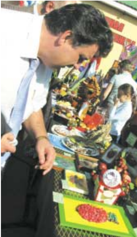
Начало на стр. 1.

В этом году управа района Северное Измайлово решила построить программу праздника по-новому. Зародилась новая традиция – фестиваль «Яблочная феерия». Основная цель этого начинания: продвижение продукции фермерских хозяйств ближайших областей России, а также поддержка малого предпринимательства. Это очень важно сегодня, и важно для всех – и для фермеров, и для покупателей, жителей нашего района. Но не менее важны и гуманитарные цели фестиваля. В конкурсе «Яблочное подворье» участвовало 22 учебных заведения, от колледжей до детских садов, и очень многие из них работают с детьми с ограниченными возможностями. Это детский сад №1078 для детей с ослабленным зрением, детский сад №1793 для детей с нарушениями речи и многие другие. Таким образом, в районе активно реализуются программы «Год равных возможностей» и «Год молодежи».